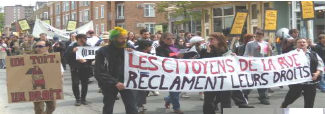
(ci-dessous) Assemblée publique en avril 2007 pour une politique en itinérance. Des résidentes de Passages dévoilent une bannière réalisée pour l'occasion.

Plusieurs organismes ont mentionné que leurs acquis se trouvent au niveau des stratégies mises en place. Ces stratégies sont nombreuses comme nous le verrons à la prochaine section.