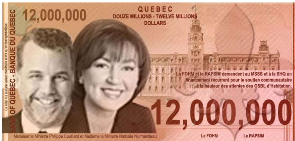
Illustration : FOHM

Le RAPSIM et la FOHM ont manifesté leur opposition nette à ce cadre. Ils ont réitéré à cette occasion la nécessité de répondre aux besoins financiers des OSBL de logement social avec soutien communautaire en demandant la mise en place d'une enveloppe nationale dédiée de 12 millions $.