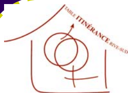
TABLE ITINÉRANCE RIVE-SUD (T.I.R.S.)