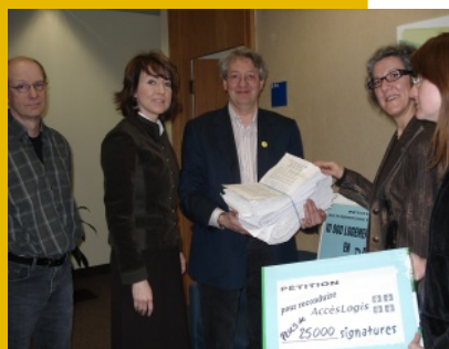
Remise des pétitions AccèsLogis à la ministre Normandeau