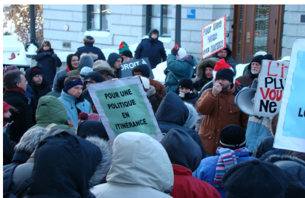
Assemblée nationale, Québec, 12 décembre 2007

La campagne se poursuit tout le mois d'avril. Elle sera clôturée par une action publique le 16 mai au cours de laquelle les appuis seront dévoilés.