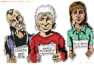
Illustration : Patrice Bergeron Conception graphique: Comme un Poisson dans l'eau

Les 15 et 16 mai prochains aura lieu à Montréal un forum sur le thème de la citoyenneté s'adressant aux personnes en