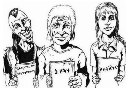
Illustration : Patrice Bergeron